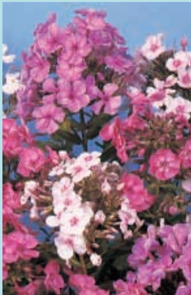
Nr. 7520 Phlox paniculata "Nieuwe Hybriden"