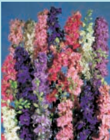
Nr. 4076 Delphinium pacific Pacific Reuzen Round Table series

4081 Blue Bird Series Blauw met wit hart.