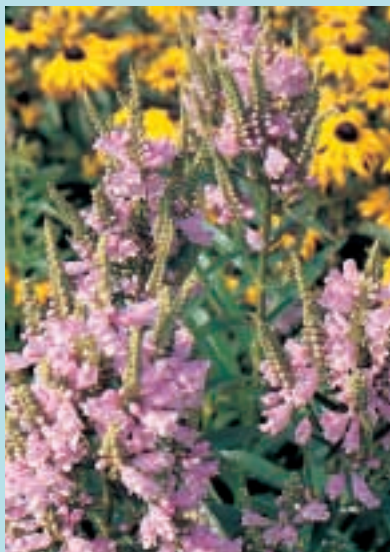
Nr. 7613 Physostegia virginiana "Rosa Queen"