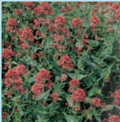
Nr. 3678 Centranthus ruber

Cristata Amigo 15 cm Vroegbloeïende "Hanankam"-Celosia in 4 bril- liante kleuren. Compact en zeer gelijkmatig voor perk- en potplantproductie.