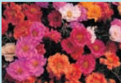
Nr. 7682 Portulaca grandiflora F 2 "Sundance mengsel"