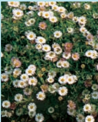
Nr. 4742 Erigeron karvinskianus