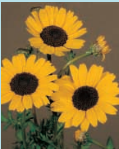
Nr. 3753 Chrysanthemum segetum Eldorado

(Amandelroosje) *3800 Dubbele gemengd. 100 gr 41,00; 10 gr 5,50