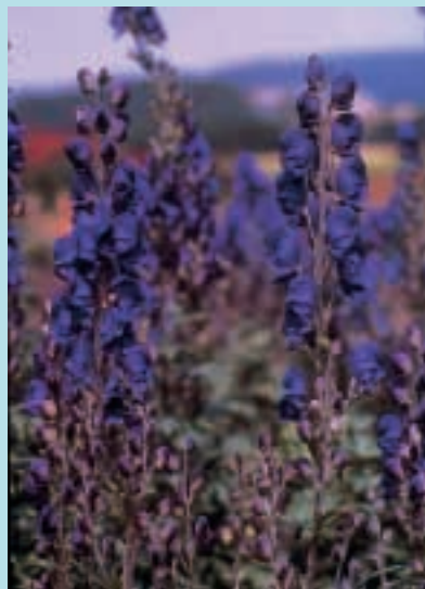
Nr. 1950 Aconitum napellus

*1980 Aestivalis bloedrood. 100 gr 15,00; 10 gr 3,00