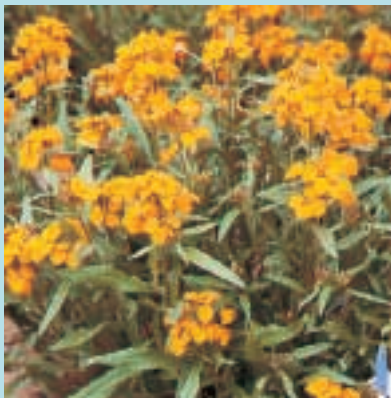
Nr. 3682 Cheiranthus allionii Oranje