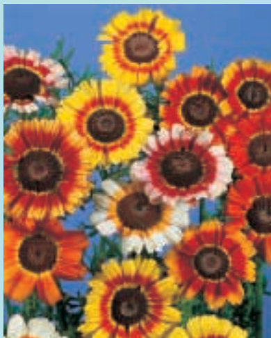
Nr. 3694 Chrysanthemum carinatum Enkele gemengd

3743 Zilverprinsesje, 40 cm Wit. 1.000 zaden 5,00