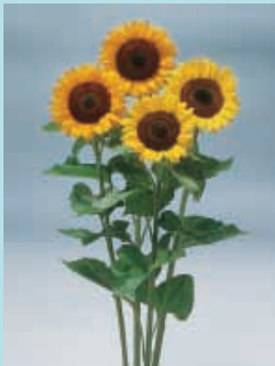
Nr. 5403a Helianthus annuus Sunrich Orange

Alle soorten gemengd. 100 gr 60,00; 10 gr 8,00