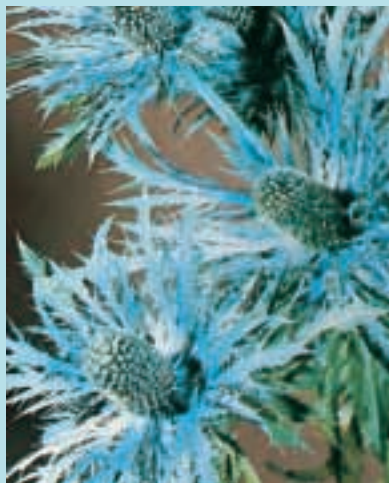
Nr. 4744 Eryngium alpinum "Superbum"

Grevillea Robusta, wordt ook wel 'Australische zilvereik' genoemd. In een jong stadium groeit de Grevillea erg snel, waardoor deze geschikt is voor een korte teelt. Attractief zijn het fijne blad die op waaiers van varens lijken en het kleur- verschil van het nieuwe en oude blad. Prijs op aanvraag.