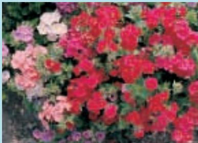
Nr. 7530 Phlox drummondii "Pracht Bloemistenmengsel"