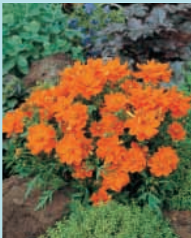
Nr. 3860 Cosmos sulphureus Sunny Red

3868 Platycentra, ignea Prima potplant. 1.000 zaden 8,00