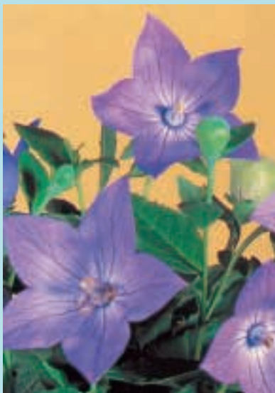
Nr. 7620 Platycodon grandiflora "Blauwe Klok"