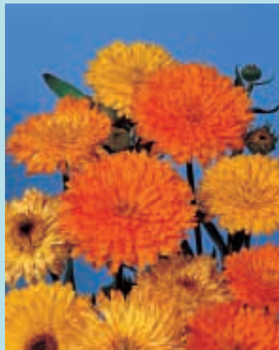
Nr. 3577 Calendula officinalis Gemengd