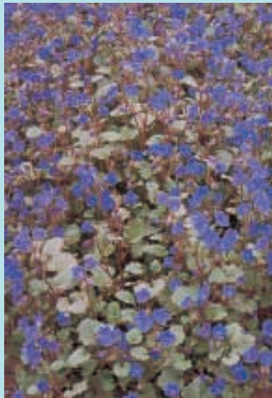
Nr. 7304 Phacelia campanularia "Blauw wonder"

20 cm Gentiaanblauwe bloemetjes met witte meeldraden 100 gr 25,00; 10 gr 4,00