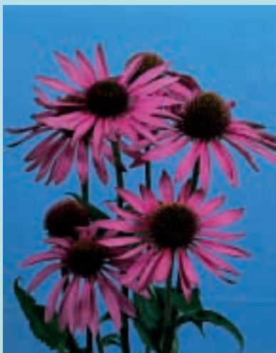
Nr. 7937 Rudbeckia echinacea Purpurea