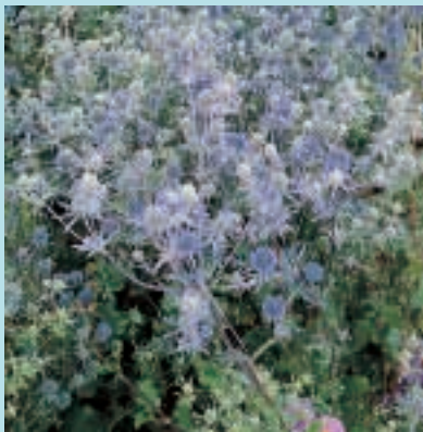
Nr. 4745 Eryngium planum