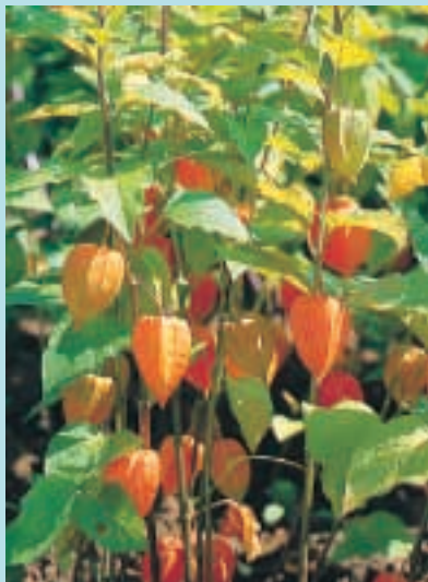
Nr. 7602 Physalis alkekengi