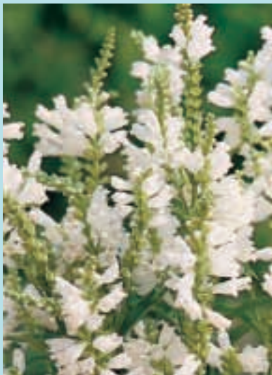
Nr. 7611 Physostegia virginiana "Sneeuwkrone"