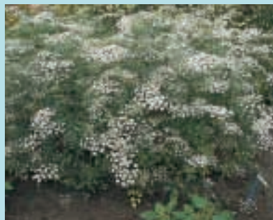
Nr. 2045 Ammi majus