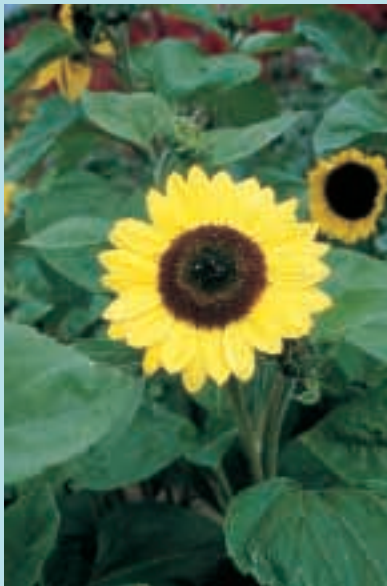
Nr. 5403 Helianthus annuus Sunrich Lemon